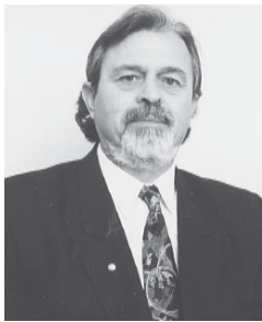
Γράφει ο Χάρις Ζάχος Συντη/χος Δάσκαλος