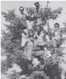
Στην παρέα μπροστά

Συνήθως, γράφουμε γι' αυτούς που έφυγαν. Γράψουμε λόγια παρηγοριάς ή για κάποιο γεγονός της ζωής τους.