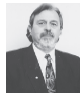
Γράφει ο Χάρις Ζάχος Συντάχως Διάκωνος -Σηγηραφείας