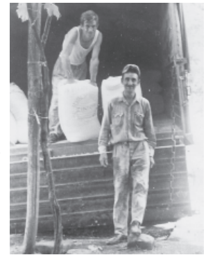
Στη δουλειά μπροστά