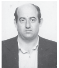
Γράφει ο Δ. ΚΟΥΚΟΣ

Την αφορμή για να γράψουμε τα παρακάτω και να προβούμε σε κάποιες ενέργειες, για να γνωρίζουν όλοι οι χωριανοί μας, την πήραμε από μία νεροποντή, στις αρχές του καλοκαιριού που έγινε στις 11 Ιουνίου 2008 στην περιοχή των Αγνάντων (κέντρο του χωριού και πάνω).