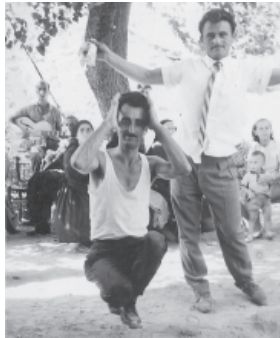
Στο χορό μπροστά

Απαραίτητος στην παρέα. Απ' αυτό που έχει θα δώσει. Φίλος του πατέρα μου, που όχι τον αγαπούσε, τον λάτρευε. Όλος ο κόμπος της Άρτας δικός του. Σε όποιο καμποχώρι κι αν πάει, θα βρει γνωστούς, φίλους, ιδιαίτερα στις Κεραμάτες.