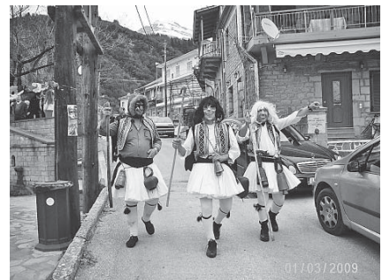
Μασκαρεμένοι Αγναντιτές στις αποκριάτικες εκδηλώσεις στο χωριό