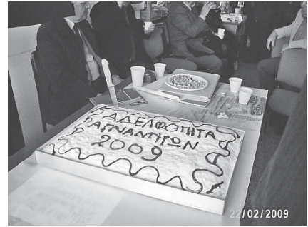
Η πίτα της Αδελφότητας