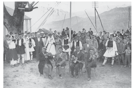
Αγναντα 1962. Γαϊτανάκι στην πλατεία τότε

Όσοι Αγναντιτές επιθυμούν να συμπεριληφθούν στο ΑΛΜΠΟΥΜ φωτογραφιών που θα εκδώσει η Αδελφότητά μας, να μας στείλουν το ταχύτερο φωτογραφίες των μελών των οικογενειών τους που βρίσκονται ή όχι στη ζωή για να συμπεριληφθούν. Η αποστολή επείγει. Τηλ. προέδρου 6978998639.