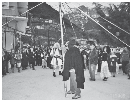
Αγναντα 2009. Γαϊτανάκι και τσίρα