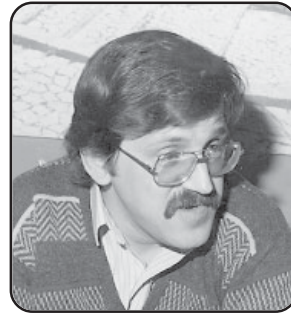
Γράφει ο Χρ. Τούμπουρος

"Πιο πέρα καίγεται ένα σπίτι, ύστερα κάποιο άλλο και μετά το δικό σου", γράφει ο Ρίτσος.