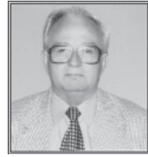
Γράφει ο ΧΡ. ΑΡ. ΠΑΠΑΚΙΤΣΟΣ

εναλλακτική πηγή ενέργειας, αφού ο χυμός τους μπορεί, με κατάλληλη επεξεργασία,