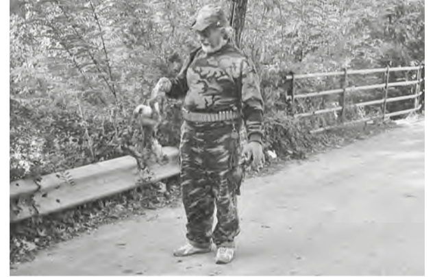
Και σε μένα έμειναν τα σκόρδα, τα κρεμμύδια και η... φωτογραφία!

Όταν στράβωνε το λαγό εκεί στην Αγία Παρασκευή, τον έβαζε στο σακίδιο με το κεφάλι και τα πόδια έξω. Όταν καθόταν για καφέ στο Σκουηκαρί-