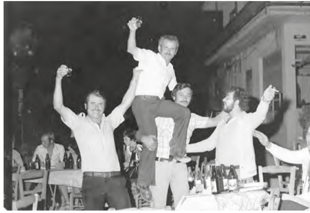
Και ο χορός καλά κρατεί.

τον πήραν οι μαστόροι παιδί απ' το Σχολεϊό να μάθει πιθοφόρι!