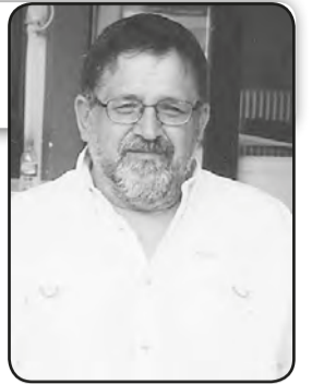
Γράφει ο Χρήστος Α. Τούμπουρος