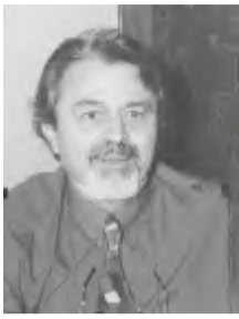
Γράφει ο Χάρης Ζάχος Συντάχτης Δάσκαλος - Συγγραφέας

Όταν το διάβασα, έσκουζα σα μικρό παιδάκι!!