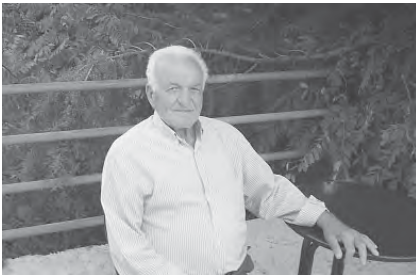
Κολόνες; Αχάλαστες κολόνες. Οι ενχές μας, τους συνοδεύουν. Να είναι πάντα καλά.