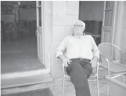
Ολόισο, ανέερο, καμαρωτό, κυταρισμένο τ' ανάστημά τους.