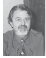
Γράφει ο Χάρης Ζάχος Συντάκτης Δάσκαλος - Συγγραφέας