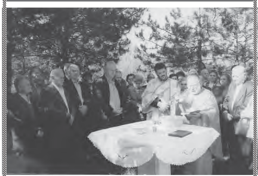
Από τον αγιασμό στο προαύλιο της εκκλησίας για την καρποφορία των δέντρων