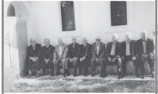
Εδώ εικονίζονται αυτοί που «βασάνε άμυνα»...

ψυχαί των τετρακοσίων μαθη-τῶν καὶ μαθητριῶν του ἐπαρ-χιακοῦ καὶ αγνοῦ των Ἀγνά-των Γυμνασίου, ἀλλά καὶ αἱ ἀμόλυντοι, ἀφελεῖς καὶ ἀχρα-ντοι ψυχαί τῆσ σπουδαζούσεσ νεότητοσ ολοκλήρου τῆσ Ἑλ-λάδοσ, ο Καθηγητικῶσ Σύλλο-γος, ομοφώνωσ ἀπεφίηματο, ὅτι, ἡ προσήκουσα τιμωρία εἰς τὸν ἰόν..... εἶναι ἡ διὰ παντὸσ ἀποβολὴ ἐξ ὄλων των Γυμνασίων του Κράτουσ καὶ ο χαρακτηρισμόσ τῆσ δι-αγωγῆσ αὐτοῦ ὡσ «Κ α κ ἦ ς».