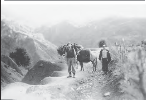
Αγιογιάτες και αδελφικοί φίλοι οι Χαρίλαος Ζιάργακας (αριστερά) και Γεώργιος Ι. Καπέλης, τη δεκαετία του '50 με τα παλιομουδάρια Γκέσα και Αράπη.