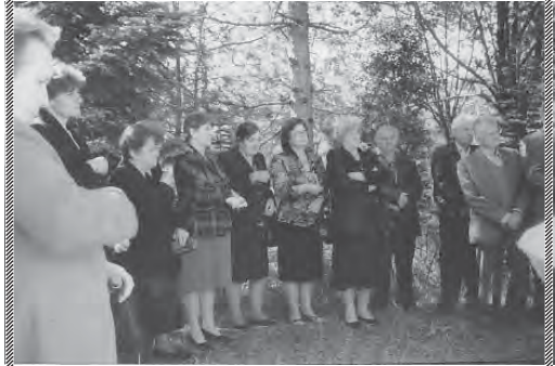
Κάτοικοι του χωριού στο προαύλιο της εκκλησίας