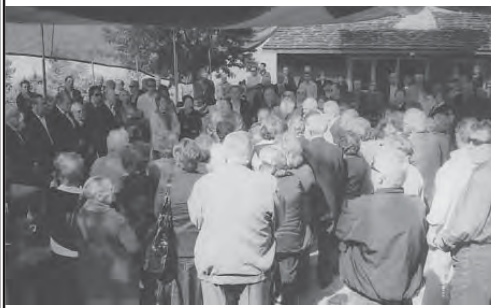
Ήταν όλοι εκεί με πολύ κέφι...