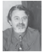
Γράφει ο Χάρις Ζάχος Συντάχτης Δάσκαλος -Σηγηγρέφας

Υ.Γ.: Ευχαριστούμε το Βασίλη που φρόντιζε να έχουμε πυρσοβεστικό όχημα στο χωριό (ακρείαστο να 'ναι). Το ποιος θα το οδηγήσει, ας εκπαιδεύσουμε τη «χειμωνιάτσα». Τι λέει Δήμαρχε;