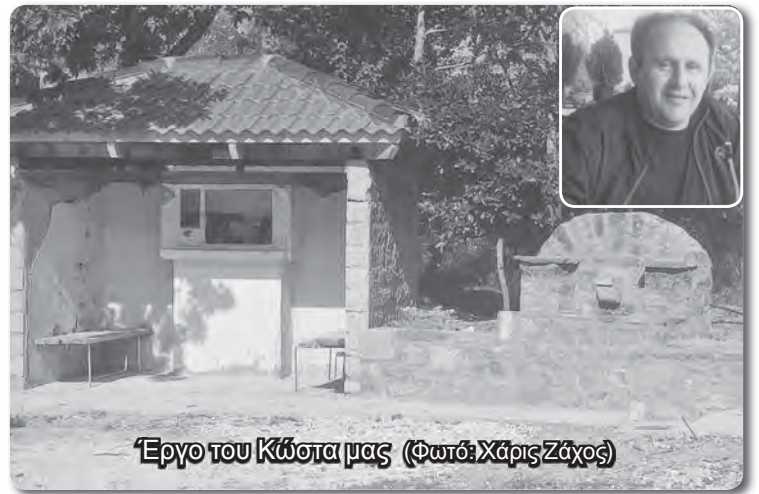
Έργο του Κώστα μας

Κώστα, αγαπημένε μας, εγώ δεν είμαι ο καταλληλότερος για λόγια καλά και όμορφα. Όσα όμως λέω, είναι λόγια