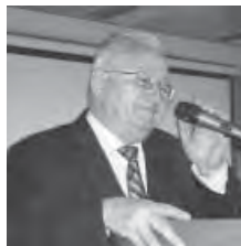
Γράφει ο ΧΡ. ΑΡ. ΠΑΠΑΚΙΤΣΟΣ

Άκουσα ένα τραγούδι γραμμένο στα Ισπανικά με μόνο Ελληνικές λέξεις, που οι Ισπανοί από χρόνια τις «πολιτογράφησαν» δικές τους! Το τραγούδι