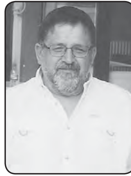
Γράφει ο Χρίστος Α. Τζούμπουρος

όμως αντισταθμίζει που γράφουμε Ελληνικά.