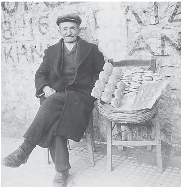
Κλούρια πρώτης κατηγορίας και κλούρια δεύτερης κατηγορίας...

Μετά το δώρο, αφού μας είχε ξετινάξει ο Μπουλιάκος με τον Επιτάφειο, ο Χ'ηιάρας με τον Αηγό-