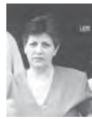
Γράφει η Αριστέα Γιαννούλα Πρόντζα

ΑΡΤΑ: 26810-27433 - ΓΙΑΝΝΕΝΑ: ΖΩΤΟΣ: 26510-24461