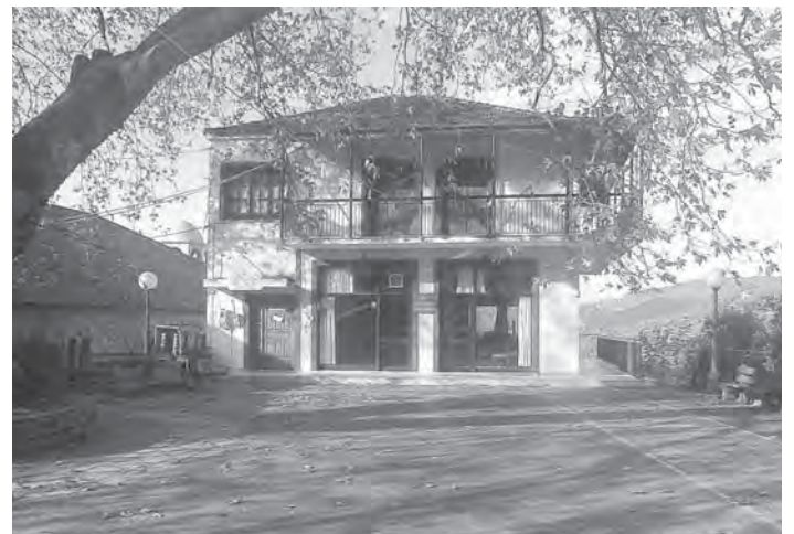
Φαίνεται πως η υπόθεση με το κατάστημα στην πλατεία της Παναγίας παίρνει οριστικά τέλος.