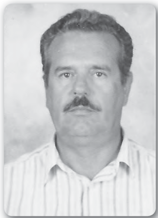
Γράφει ο Γιάννης Κατσικογιώργος Συνταξιούχος δάσκαλος

Όμορφα και ξεκούραστα περνούσε το Σαββατοκύριακο, όταν κατά το μεσημέρι της Κυριακής ξαφνικά μαθαίνουμε πως ο συγχωριανός μας ο Βαγγέλης ο Κουτσοσπύρος, που με το «καρναβαλάκι» του Λεμονιά εκτελούσε το δρομολόγιο Άρτα-Άγναντα, είχε κατέβει από τ' Άγνα-