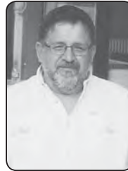
Γράφει ο Χρίστος Α. Τσούμπουρας

-Μπάριμα, όταν έψελνε ο παπάς, εσύ είχες ένα ματράκι – αναπήρα και κραπ, κρουπ, προσπαθούσες να ανάψεις τσιγάρο. Και, όταν σου είπα, μπάριμα μην ανάβεις τσιγάρο, γιατί γίνεται μυστή-