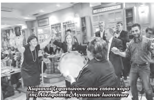
Χωριανοί Ξεφραντινών στον επίσημο χορό της Αδελφότητας Αγναντιών Ιωαννίνων