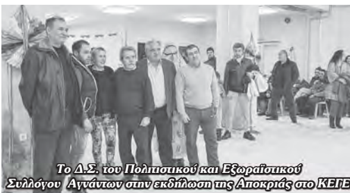
Το Δ.Σ. του Πολιτιστικού και Εξωραϊστικού Συλλόγου Αγνάντων στην εκδήλωση της Αποκριάς στο ΚΕΓΕ