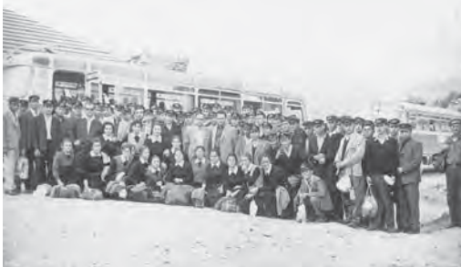
Στα Φράστα έτοιμοι να επιβιβαστούμε στα λεωφορεία