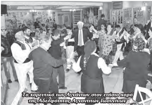
Το χορευτικό των Αγνάντων στον επίσημο χορό της Αδελφότητας Αγναντιών Ιωαννίνων