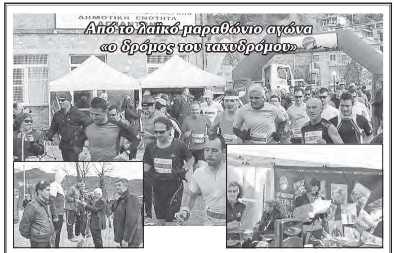
Από το λαϊκό μαραθώνιο αγώνα «ο δρόμος του ταχυδρόμου»