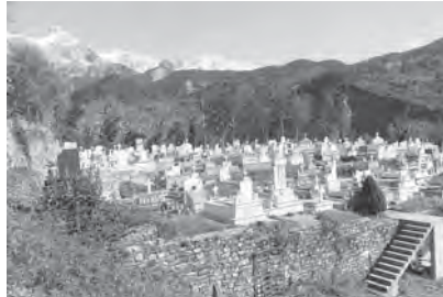
Το κοιμητήριο Αγίου Δημητρίου