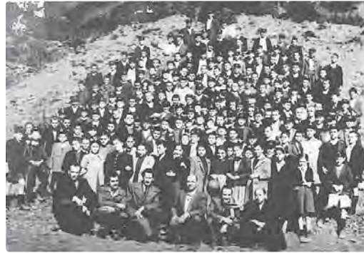
Οι μαθητές του Γυμνασίου Αγνάντων με τους καθηγητές τους. 1954

Ας διαβάσουν λοιπόν αυτή την αληθινή ιστορία. Δυο μαθητές του Γυμνασίου Αγνάντων, δυο χωριανοί (από το Αμπελοχώρι), δυο φίλοι, δυο συμμαθητές, δυο συνοδοιπόροι..., αγωνιστές της μάθησης.