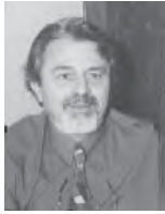
Γράφει ο Χάρης Ζάχος Συντάχτης Δάσκαλος -Συγγραφέας

Όταν έφυγε απ' τη ζωή η μάνα μ', έπρεπε να αρχίσει η διαδικασία για τα περαιτέρω.