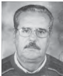
Γράφει ο Γιάννης Κατσικογιώργος Συνταξιούχος δάσκαλος

Παίρνει τα λιπάσματα, τα τοποθετεί προσωρινά σ' ένα πεζούλι απέξω και κατευθύνεται προς το κοντινό καφενείο του χωριού να πει έναν καφέ, να