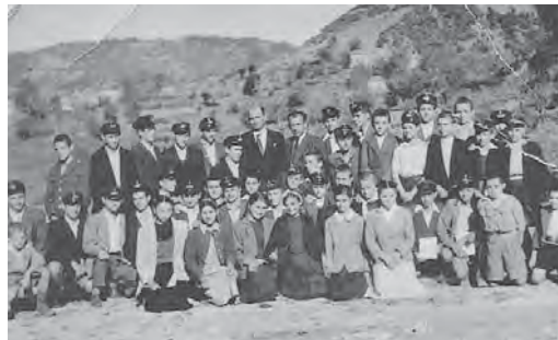
Οι μαθητές/ες του Γυμνασίου Αγνάντων με τους καθηγητές τους. 1956.

γκαίο φαγητό-για να βγάλουν τη βδομάδα- και καμιά αλλαξιά ρούχα, έπαιρναν το δρόμο της επιστροφής.