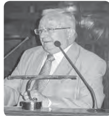
Γράφει ο Χρ. Αρ. Παπακίτσος

Ο ι «μπαροφες» που έλεγαν οι πολιτικοί μας από τα «τραπεζοθήρα» για πολλές μέρες μετά τις τριπλές εκλογές (Δημοτικές, Περιφερειακές και Ευρωεκλογές) προκειμένου να ερμηνεύσουν τα αποτελέσματα και τα «κρυπτογραφημένα» μηνύματα που αυτές έστειλαν, ήταν ξεκαρδιστικές!... Ο καθένας έδινε την ερμηνεία που τον βόλευε και μετέφραζε το μήνυμα στη δική του προσωπική γλώσσα που κανένας από τους συνομιλητές του και από εμάς τους τηλεθεατές δεν την καταλάβαινε. Περίμενα με αγωνία και ανησυχία να ακούσω πώς ερμηνεύαν τα μηνύματα που έστειλαν τα εκλογικά αποτελέσματα δυο πολύ ευαίσθητων παραμεθόριων νομών, της Ροδόπης και της Ξάνθης , αλλά «εις μάτην»... « Μούγκα στη στρουόγκα »!... Στους νομούς αυτούς πήρε μέρος στις Ευρωεκλογές το νεοπαγές «Κόμμα Ισότητας