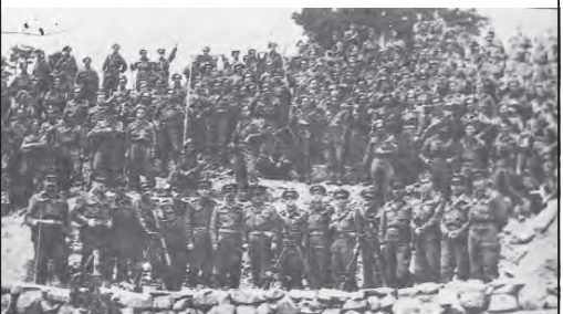
Το πρωϊκό 6ο Τάγμα Χωροφυλακής Ρούμελης

Τα χρόνια πέρασαν, οι φωτογραφίες μένουν, να θυμούνται οι παλιοί και να μαθαίνουν οι νέοι.