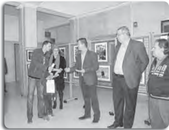
Από την απονομή του πρώτου βραβείου