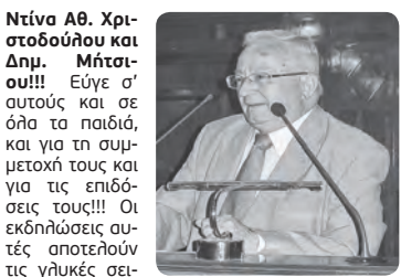
Γράφει ο Χρ. Αρ. ΠΑΠΑΚΙΤΣΟΣ