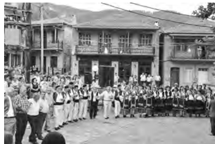
Καγκελάρι Πλ. Κοιμ. Θεοτόκου 2012

Εθνικός , γιατί ήταν ένας τρόπος να συγκεντρώνονται οι χωριανοί και να ανταλλάσσουν γνώμες χωρίς να γίνονται αντιληπτοί από τους Τούρκους.