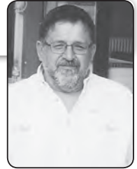
Γράφει ο Χρήστος Α. Τσιμπουρούς

βάλει μυαλό και κατανοήσουμε τι εστί παράδοση, πανηγύρι και λαϊκός πολιτισμός. Έχουμε μέχρι του χρόνου καιρό να σκεφτούμε, να αποδεχτούμε και να προετοιμαστούμε. Καλά πανηγύρια, λοιπόν, όποτε κι αν γίνουν.