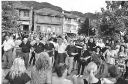
Καγκελάρι Πλ. Κοιμ. Θεοτόκου 2019

Το Καγκελάρι χορεύεται από όλους τους κατοίκους του χωριού, αλλά και από όσους ξένους παρευρίσκονται. Είναι λεβέντικος, λιτός και αυστηρός χορός. Οι εκατοντάδες των χορευτών που συμμετέ-