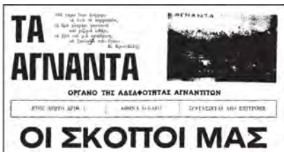
Αυτό ήταν το πρώτο φύλλο της εφημερίδας μας το 1977.

Παρ' όλες τις δυσκολίες και ο δύο στόχοι επιτεύχθηκαν, έτσι την 31/5/1977 έχουμε το πρώτο φύλλο της εφημερίδας "Τα Άγναντα", με υπεύθυνο