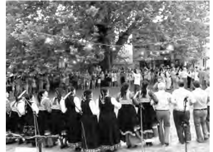
Καγκελάρι Πλ. Κοιμ. Θεοτόκου 2012

Ο κορυφαίος του χορού κρατιέται από τον δεύτερο με μαντίλι, για να μπορεί να αυτοσχεδιάζει. Στο (2), το πόδι δεν πατά στο έδαφος, αλλά σηκώνεται ψηλά, μονοκόμματα, χωρίς, δηλαδή, να λυγίζει και